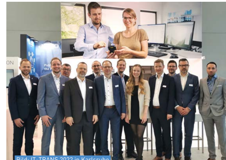
Bild: IT-TRANS 2022 in Karlsruhe

Die letzte Messe, auf der wir in diesem Jahr sein werden, ist die InnoTrans in Berlin. Die InnoTrans ist eine internationale Messe für Verkehrstechnik und wird vom 20. bis 23. September 2022 auf dem gesamten Berliner Messegelände stattfinden. Unser Stand befindet sich in Halle 2.1 mit der Standnummer 560. Dort werden wir ebenfalls unser gesamtes Produktportfolio rund um das AMCON.SYSTEM präsentieren. Vor Ort können Sie sich selbst ein Bild von unseren Produkten machen und diese ausgiebig testen. Natürlich wird es in diesem Jahr auch wieder unsere berühmten AMCON-Waffeln sowie diverse Kaltgetränke und Kaffee geben. Ab 16 Uhr laden wir außerdem jeden Besucher gerne auf ein leckeres Bier an unserem Stand ein. Wir freuen uns auf einen regen Austausch und hoffen auf ähnliche Erfolge wie auf der diesjährigen BUS2BUS und IT-TRANS.